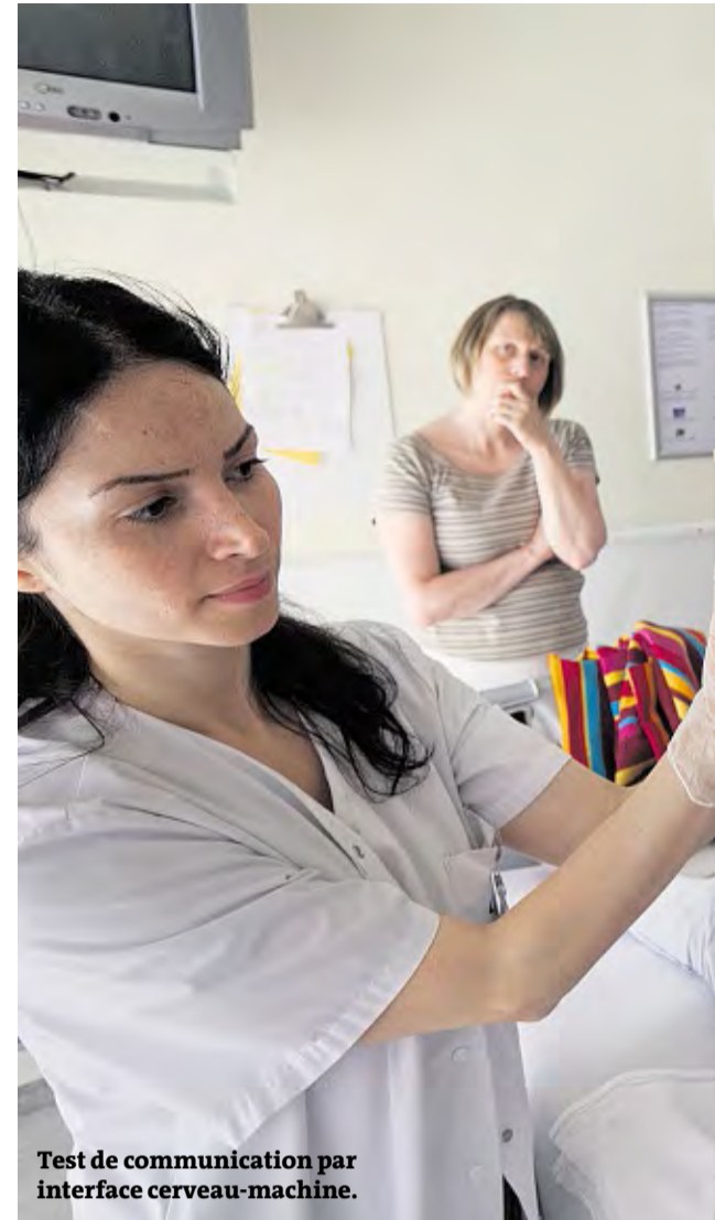
Test de communication par interface cerveau-machine.