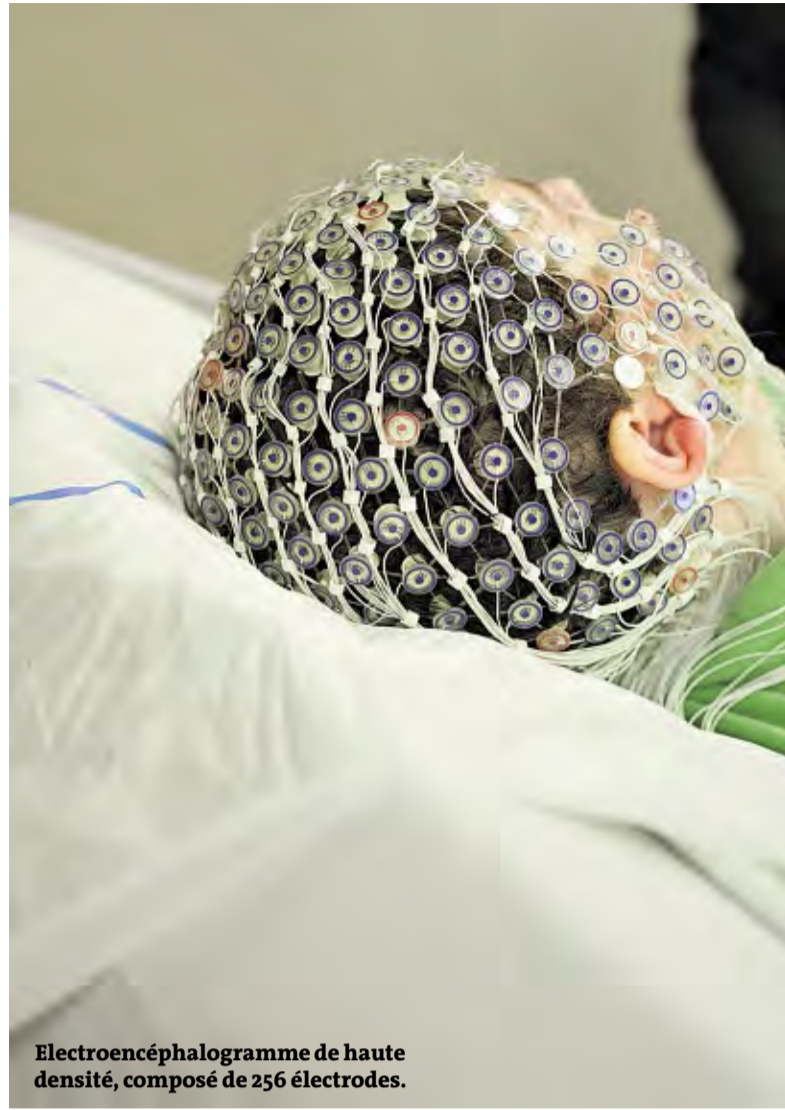
Electroencéphalogramme de haute densité, composé de 256 électrodes.