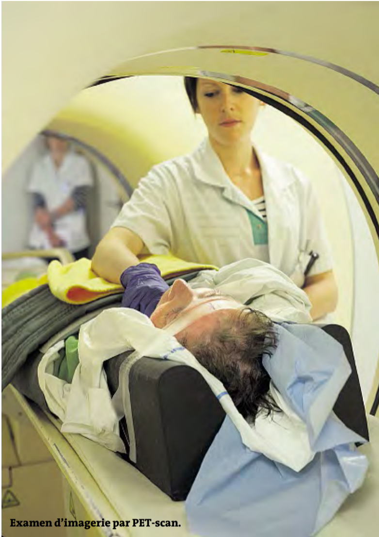
Examen d'imagerie par PET-scan.